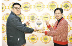
▲基督教香港信義會馬鞍山信義學校代表