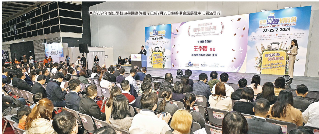
▼「2024年傑出學校遊學團嘉許禮」已於2月25日假香港會議展覽中心圓滿舉行