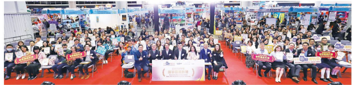
▲中學組一眾得獎中學、機構與嘉賓大合照。