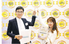
▲中華基督教青年會小學代表