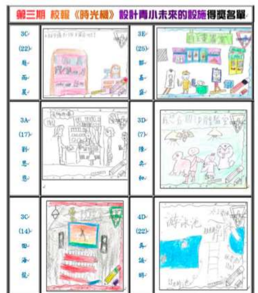
▲ 學生設計未來校園的設施