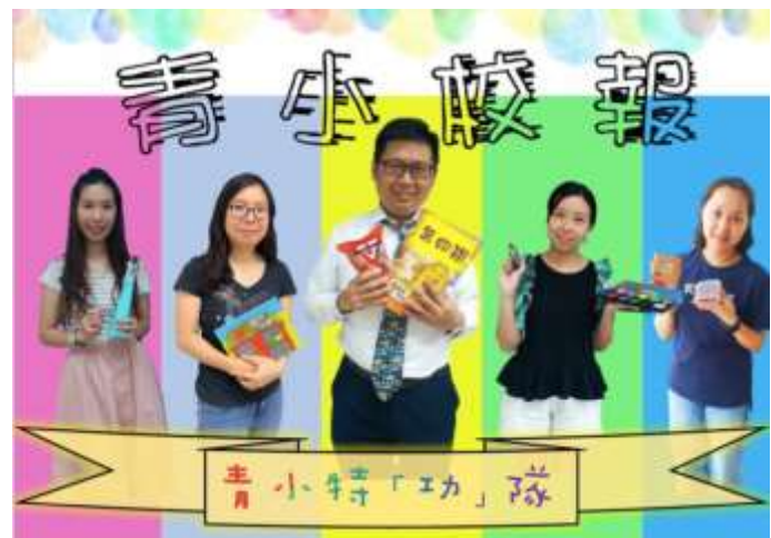
▲ 第四期《青小校報》：「青小特功隊」，學校重要的家長義工