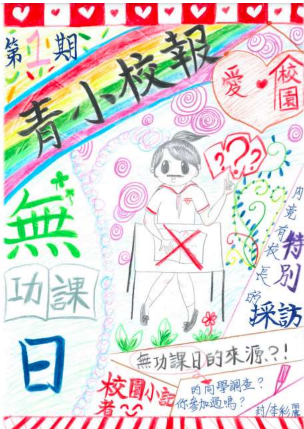
▲ 第一期《青小校報》：「無功課日」，由學生設計封面（青小舊生：李彩麗）

你有聽過讓你心情愉快的歌曲嗎？有看過讓你感動的電影嗎？那麼有閱讀過讓你留下深刻印象的文字嗎？文字的溫度不需用探熱計去量度，需要的是閱讀者用心地去感受其帶出溫暖人心的訊息。