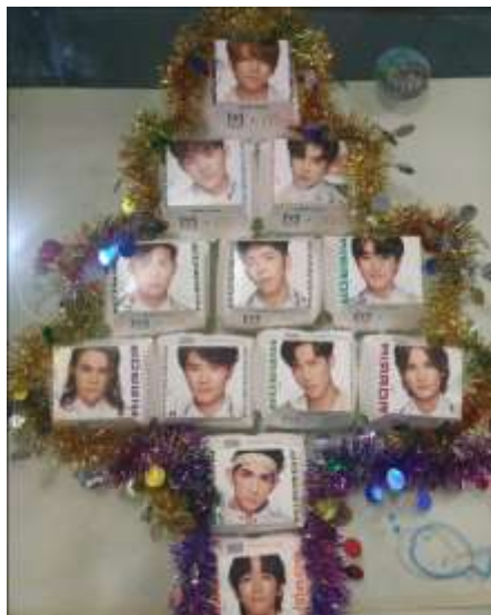
◀ 學生參與「以最低成本最高創意聖誕裝飾」設計