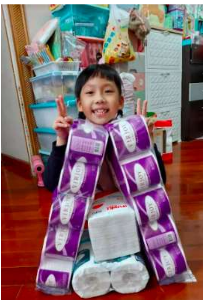
▶ 這個聖誕裝飾設計真的令不少女士羨慕

我們相信每個小孩的創造力驚人，青童當然當仁不讓，《青小校報》透過舉辦不同的活動和比賽，激發青童的創造力，培養創意思維。