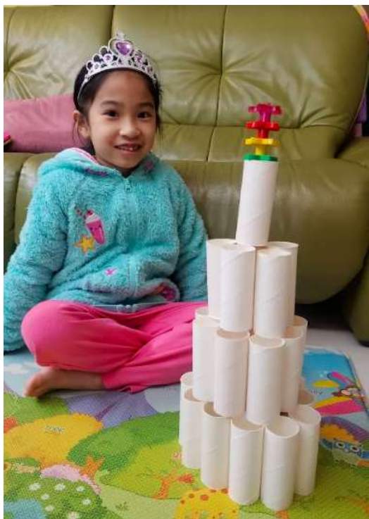
▼ 媽媽不用做家務了！