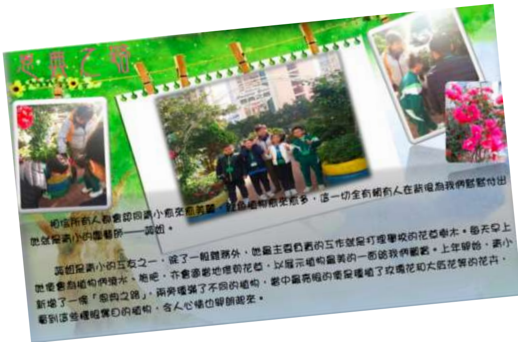
▲ 小記者正訪問青小綠手指蕊姐，蕊姐令青小每一處都生機勃勃。

每天匆匆來到校園，你有試過靜靜地、一步一步欣賞校園之美嗎？青小相信這裏的人和事，都是成就美好校園必不可少的一塊塊拼圖。