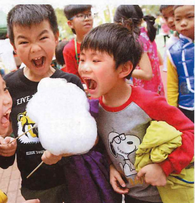
▲青小實行上午上課下午活動的方針，學生都很享受校園生活。