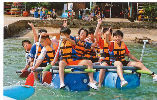
▶學生於畢業營時在營地教練指導下紮好一艘木筏，班主任與學生一起乘坐，體現互信。

孫校長回憶說，有一年一位由社工轉介的女孩申請入學，因為不斷轉換寄養家庭，環境比較不穩定，本來應該不符合入讀的條件，但最終還是碰巧與她面談了，發覺她有禮、乖巧、樂於與人溝通，最後取錄了她。雖然老師可能要花多點工夫培育及陪伴她，但見到她健康成長，亦感安慰。