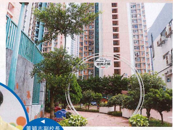
▲短短的「恩典之路」，卻充滿生命力。