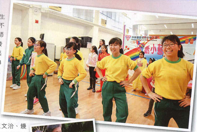
▲舞蹈是青小學生最愛的活動之一，不時在比賽獲獎。

至於課外活動，青小的學生在機械人設計頗有成績。除了學生有興趣，老師帶領同學做出好成績，也是功不可沒。在剛舉行的「創意思維世界賽香港區賽2018」(Odyssey of the Mind 2018)，青小取得第一組別(小學)問題四的冠軍，獲得前往美國愛荷華州立大學參加世界賽的資格，與來自600個州份及地區的队伍比試。之前兩年，學生成為「國際機械人奧林匹克比賽」香港代表隊，去年到國內城市鞍山參加國際機械人奧林匹克比賽，學生徹夜主動在酒店房間修理調整參賽作品，表現出來的主動性，特別令孫校長感動，「我們證明了全人教育不只是個口號。」舞蹈也是青小的強項，尤其中國舞、集體舞，雖然只是開始舞蹈活動兩、三年，但已不斷取得佳績，例如於「校際舞蹈節」獲取甲等獎。校方鼓勵學生放眼世界，早前師生到台灣金門進行單車環島之旅，除了認識當地的風土文化，如金門著名的「風獅爺爺」，學生也與金門開瑄國民小學的學生交流，校長認為是難得的海外學習體驗。