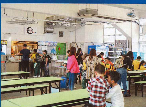
小食部現在也為學生提供早餐。