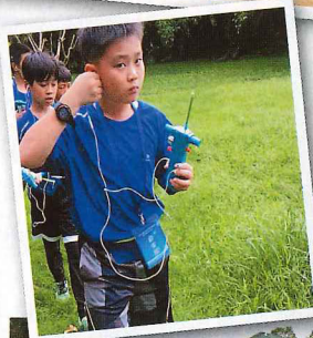
◀學校引入外國大熱的無線電測向遊戲，訓練學生的解難能力。