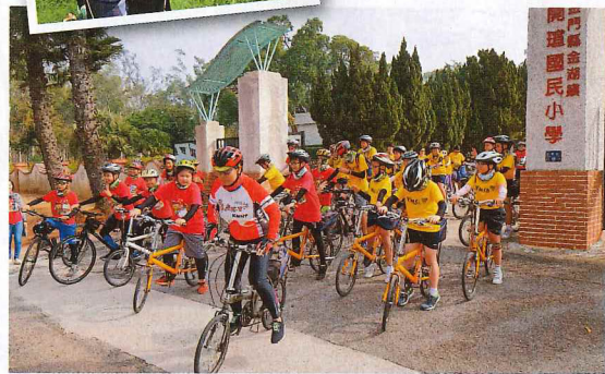
▲金門單車追風行，沿途到達每個check point，還可以利用虛擬人工智能科技，認識「風獅爺爺」的不同面貌。