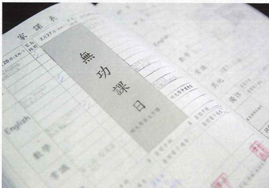
▶「無功課日」已印在學生的手冊上，家長可一早計劃親子時光。

雖然八成學生都會升讀聯繫的直資中學中華基督教青年會中學，升學壓力好像較小，但並不表示青小對學生的學業成績有所鬆懈，反而各方面都在穩步上揚，以學生的英文閱讀水平為例，青小的學生一直都在進步。孫校長指出，出色的數據不但說服了學生家長，也說服了教師學校政策正朝著正確的方向發展。