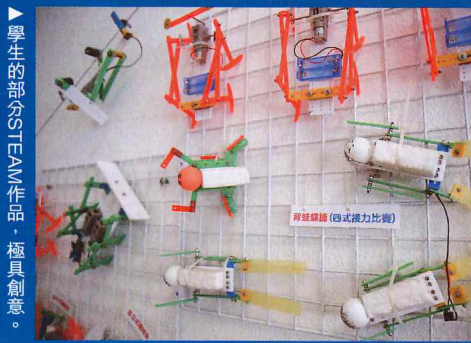
學生的部分STEAM作品，極具創意。