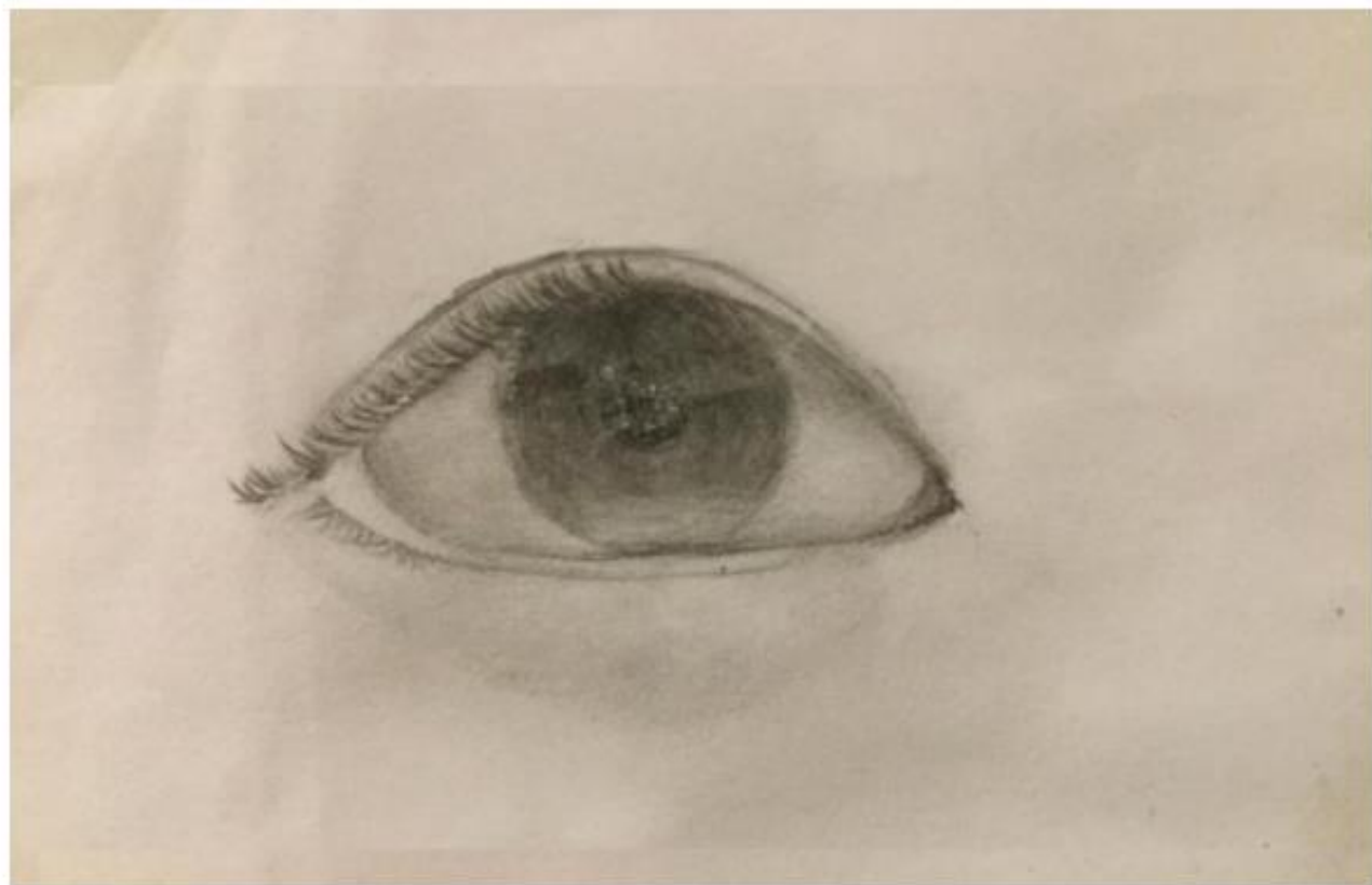
^小六的「眼睛素描」習作

另外視藝科涵括普普藝術、雕塑、拼貼等，老師會介紹不同畫家、畫風，並引領學生到網上藝術館欣賞展品。他們之後就要發揮創意、按自己的喜好，二次再進行創作。體育科就會學習中國傳統技藝，譬如：扯鈴、蹴鞠、毬子等。學生亦會有機會學跳舞，學完之後更要拍片上傳給老師，好玩又有助強健體魄！